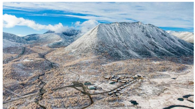
Зун-Холбинское золоторудное месторождение